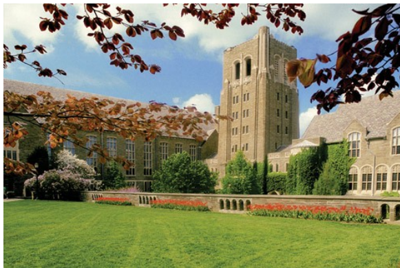
美国前十名的 康奈尔大学法学院