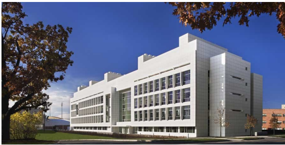
常春藤名校美国前十名的 康奈尔大学工学院