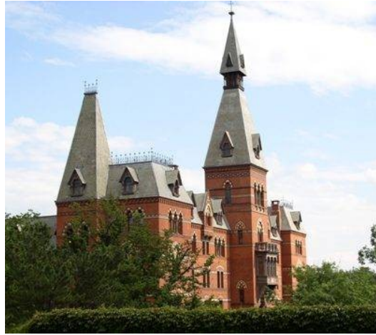
美国前二十名的 康奈尔大学Johnson管理学院