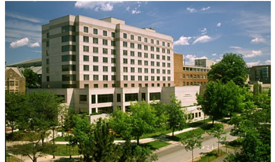
世界排名第一的 康奈尔大学酒店管理学院